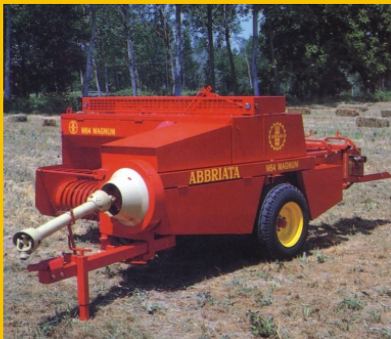
General view Общий вид