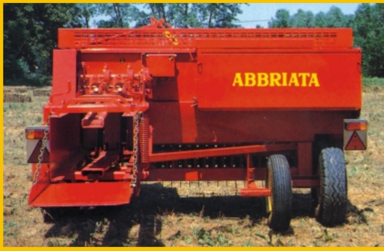
Rear view with third wheel mounted Вид сзади с установленным третьим колесом