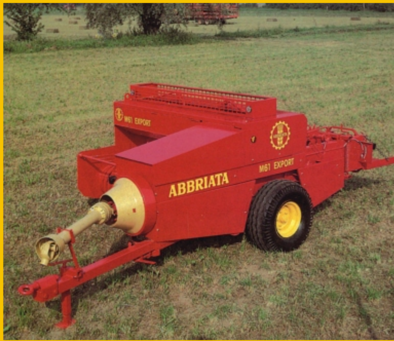
General view Общий вид