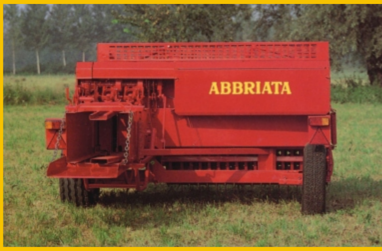
Rear view with the side pick-up wheel mounted behind Вид сзади с колесом, установленным на задней части подборщика